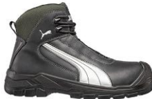
CASCADES MID 630210