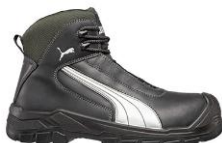
CASCADES MID 630210